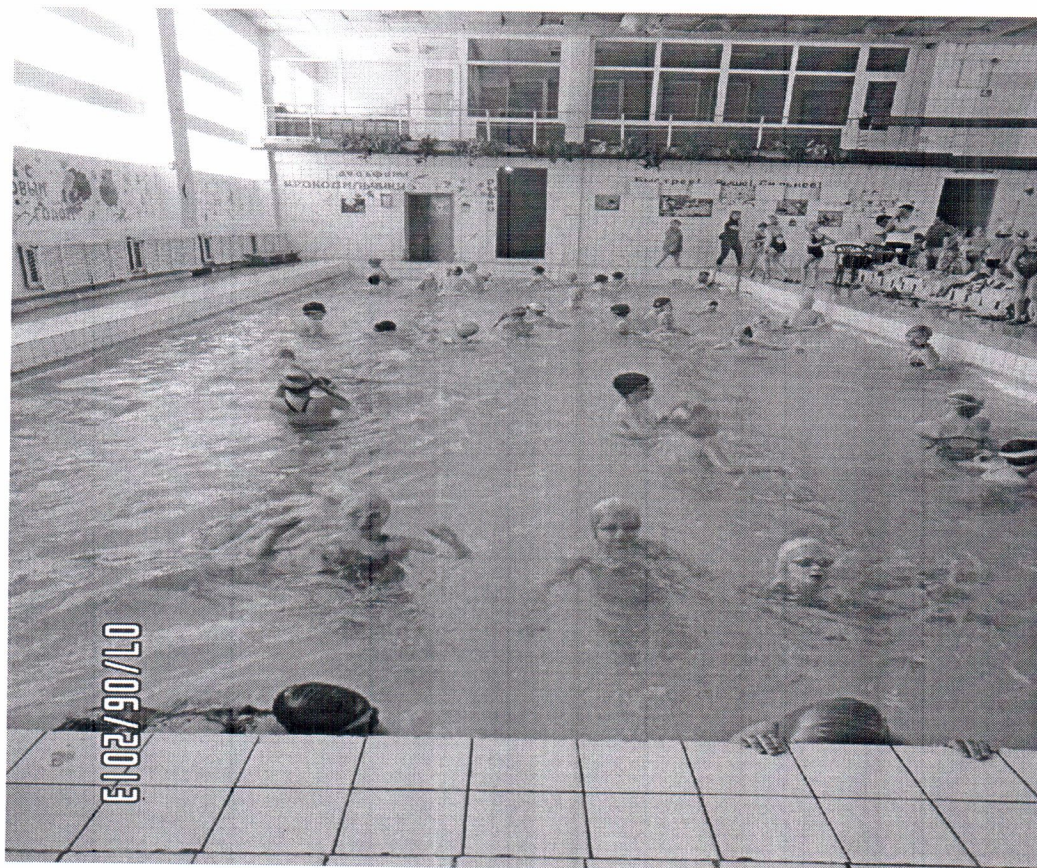
«Если хочешь быть здоров...» (водные процедуры в бассейне «Обь»)