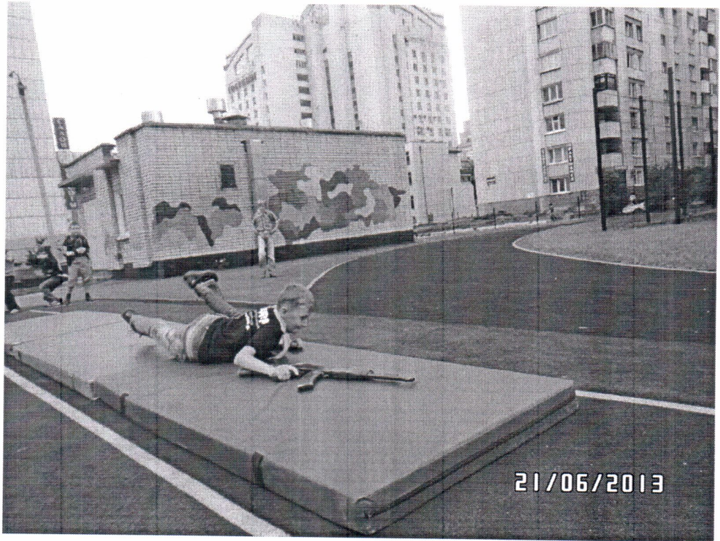
Военно-спортивная игра «Зарница»