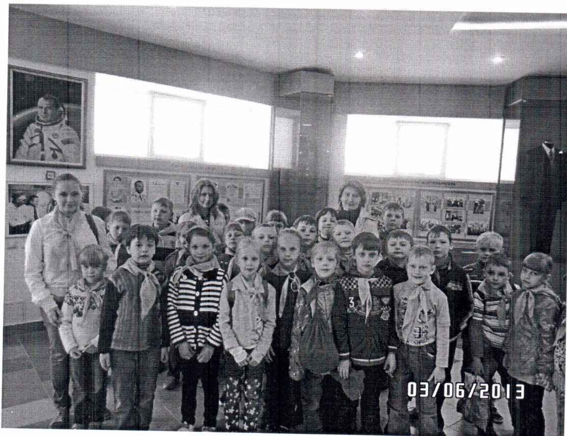
Посещение музея космонавтики имени Г.С.Титова в с. Полковниково